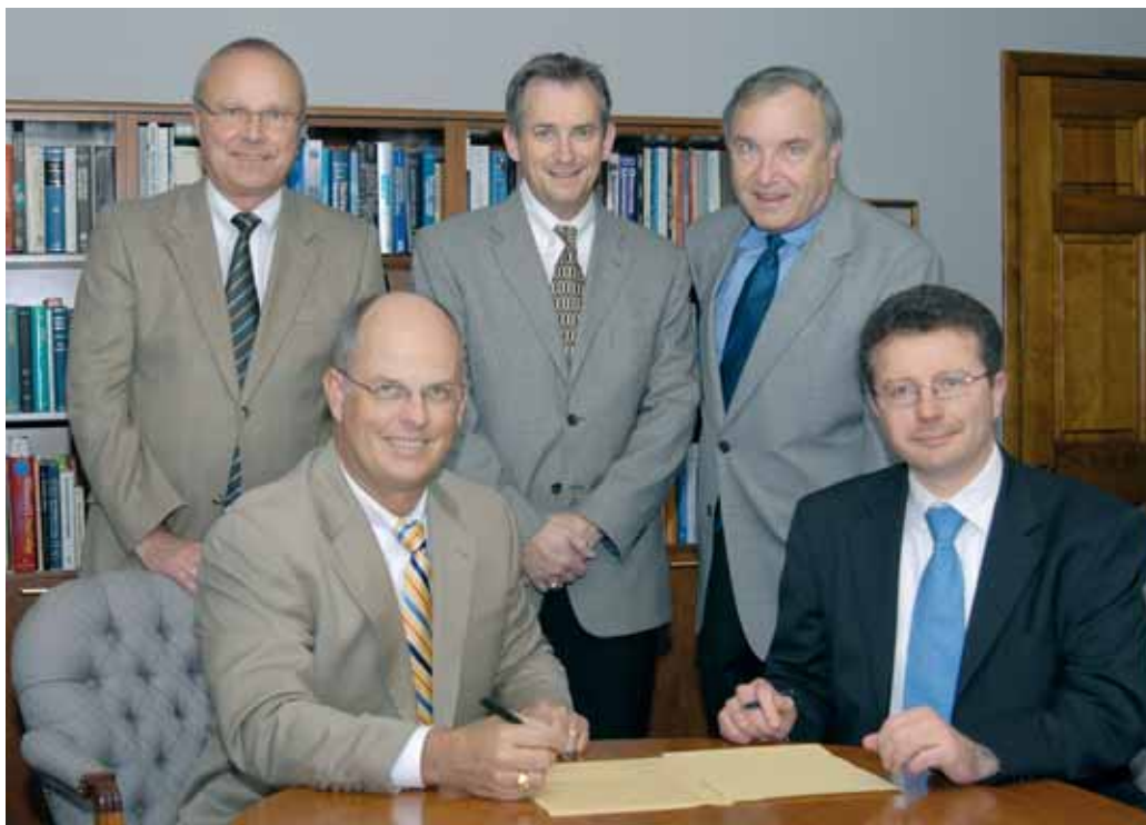
Vertragsunterzeichnung an der University of Louisville – Kooperationsvereinbarung für den Master of Engineering

Das Curriculum wurde speziell für Interessenten gestaltet, die ihre berufliche Zukunft in technischen Führungspositionen internationaler mittelständischer und größerer Unternehmen sehen. Die eingesetzten Professoren weisen durchgehend breite Erfahrungen in diesen Unternehmen auf. Dementsprechend wird ein großer Teil des Studiums auf der Grundlage zum Teil realer Praxisfälle absolviert. Auch die Master-Thesis weist eine starke Praxisorientierung auf. Im sogenannten Engineering-Project