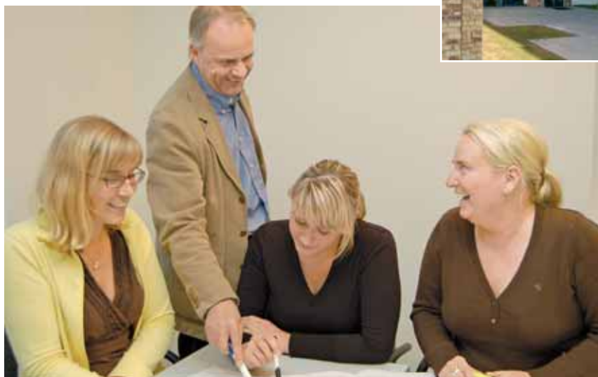
Studienzentrum der HFH Hamburg-Alsterdorf – im Unterricht

Nicht nur das HFH-Studium, auch Mitarbeiterfortbildungen werden in Alsterdorf angeboten – etwa auf den Gebieten Behindertenhilfe, der Krankenhausbehandlung und der schulischen und beruflichen Ausbildung zahlreiche Vernetzungsmöglichkeiten bietet – sei es für Praktika der Studierenden oder den Austausch von Lehre und Praxis.