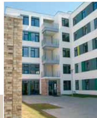
Studienzentrum der HFH Hamburg-Alsterdorf – Räumlichkeiten im Paul-Stritter-Weg

Wunder zufolge steht der neue HFH-Studiengang Gesundheits- und Sozialmanagement für die Modernisierung im Sozialbereich und die notwendige Professionalisierung der Leitungskräfte. Die Ansiedlung des Studienzentrums in Alsterdorf entspreche damit, so Wunder, dem Selbstverständ-