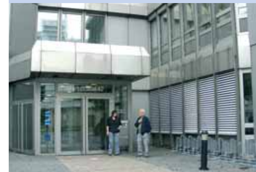
Die neuen Räumlichkeiten des HFH-Studienzentrums München, Marsstraße 42.

Obwohl zum Teil etwas in die Jahre gekommen, waren die „alten“ Räume des Studienzentrums München in der Landwehrstraße 73-75 für die Studierenden und Mitarbeiter des Studienzentrums in all den Jahren doch ein Stück Heimat geworden – man hat sich eben arrangiert.