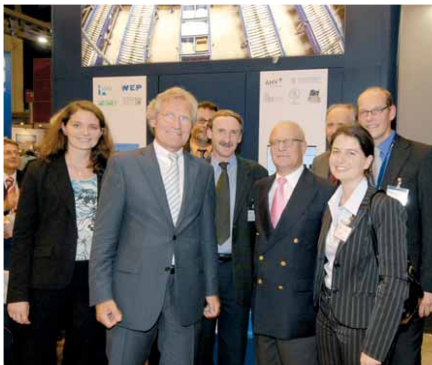
Der Hamburger Wirtschafts-Senator Uldall informierte sich auf dem Stand der Logistik-Initiative über das Angebot der Ausbildung in dieser Wachstumsbranche.